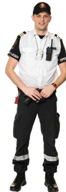
Statlig eller kommunal virksomhet som har et definert ansvar innen beredskap