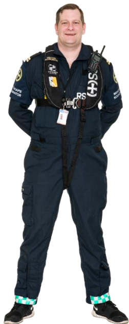
Aktør som samarbeider tett med nødetatene