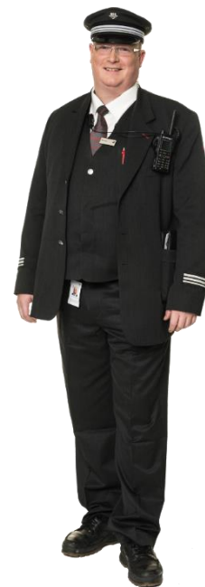
Virksomhet som er utøver av viktige samfunnstjenester