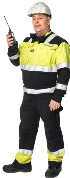
Virksomhet som er eier eller operatør av kritisk infrastruktur og samfunnsfunksjoner