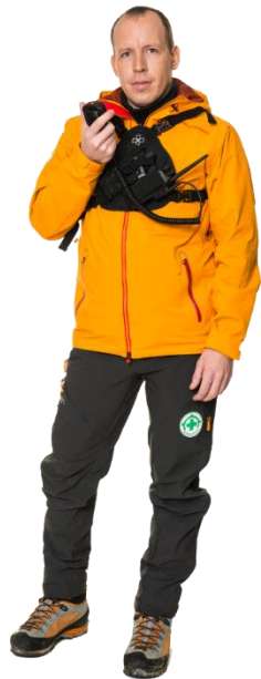
Virksomhet som er knyttet til norsk redningstjeneste